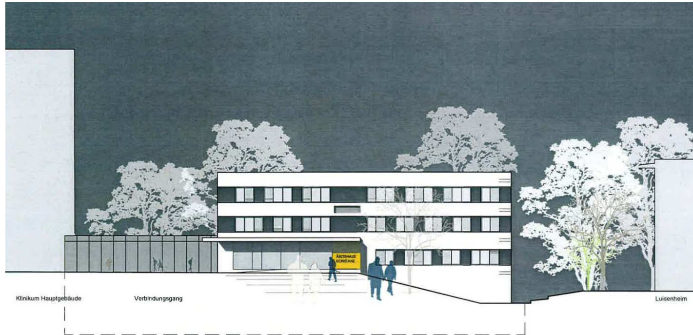
ANSICHT VON NORDEN (HAUPTTEINGANG) M. 1:100